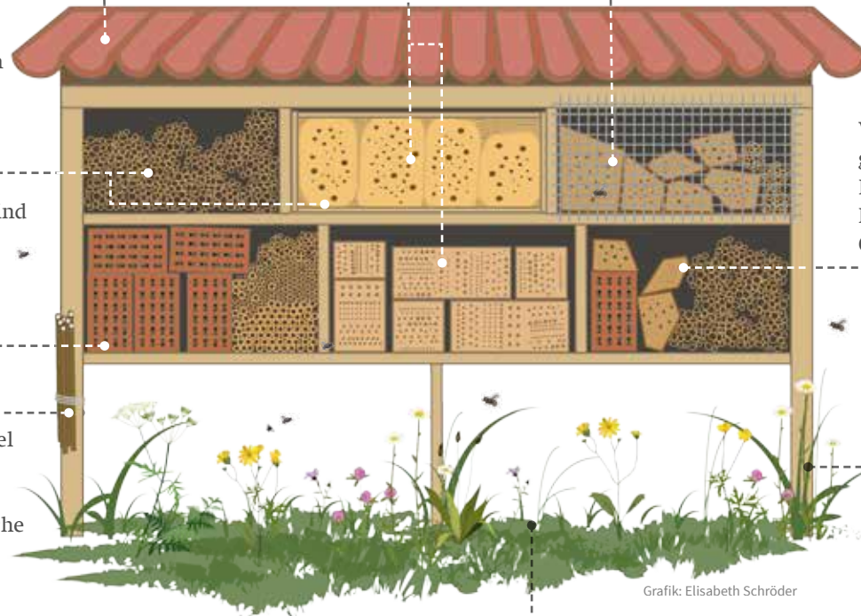
Grafik: Elisabeth Schröder

Das Hotel nicht direkt auf den Boden stellen, damit keine Feuchtigkeit von unten eindringt.